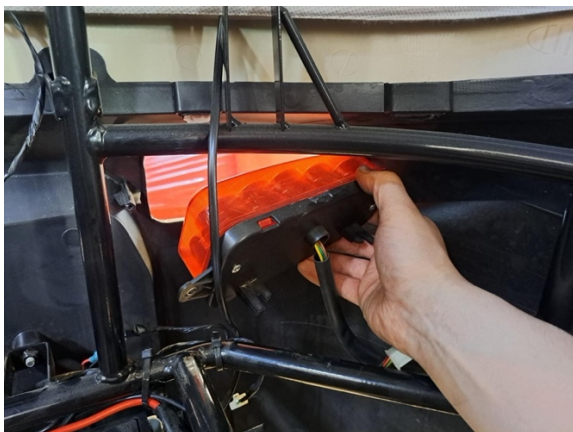
Ota takavallo pois.

Uuden osan asennus käänteisessä järjestyksessä.